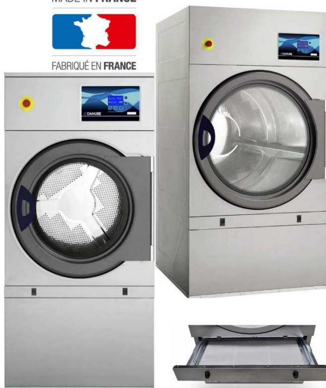
новый металлический фильтр